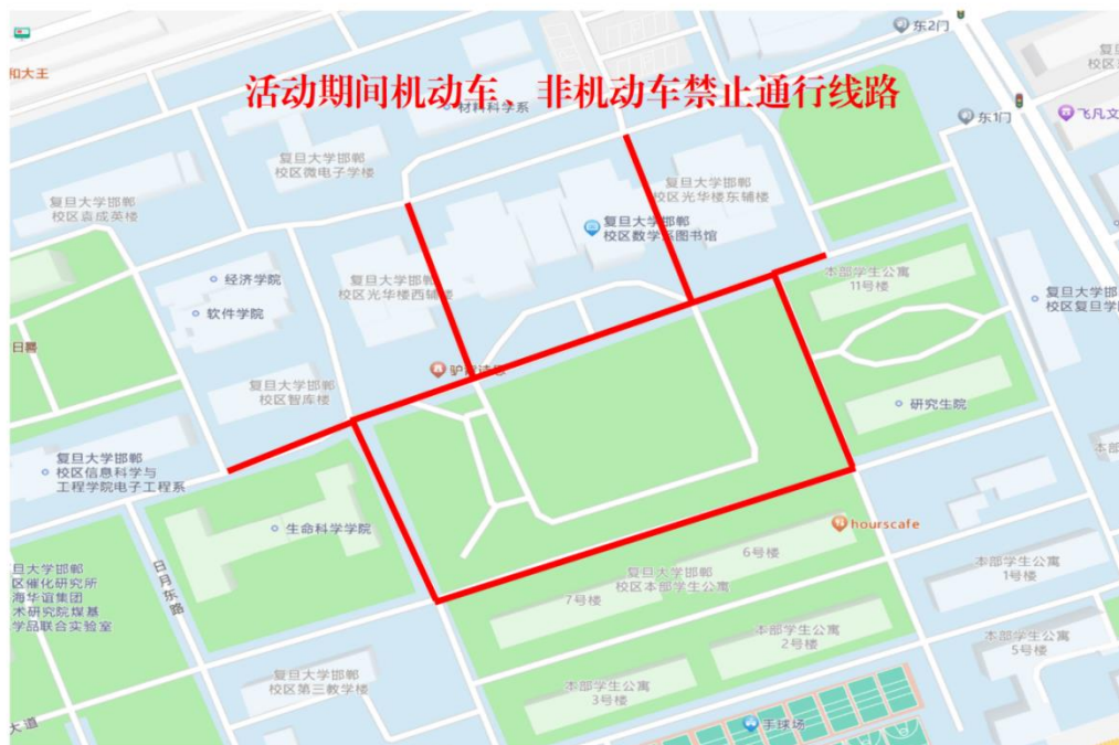
附图 2：活动期间机动车、非机动车禁止通行区域示意图